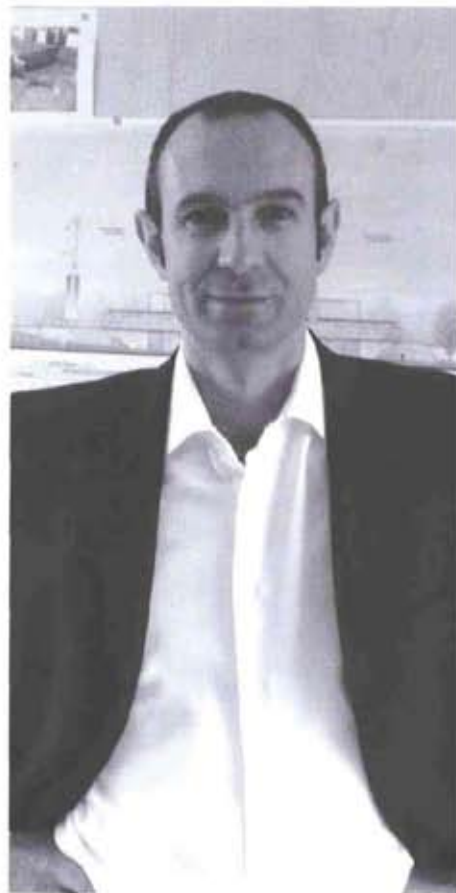
Paolo Bodega. Paolo Bodega.

La forma dell'involucro deriva dal "monolite" (dal disegno quadrangolare ortogonale) sottoposto poi a una deformazione per evoluzione darwiniana. Alla struttura elementare si aggregano le appendici, rappresentate dall'ambiente relax (a Nord-Est), l'ambiente hobby (a Est) e l'area fitness (a Sud). Ogni spazio definisce la propria forma: ai tradizionali locali interni (bagno, camere, soggiorno, cucina) si sostituiscono aree configurabili, duttili. Le barriere fisiche e psicologiche, pur garantendo la privacy individuale, si annullano creando un unico ambiente e crescendo con l'uomo. Il cuore della casa è l'area wellness, integrata alla serra: si realizza così un connubio acqua-natura attorno al quale si sviluppano